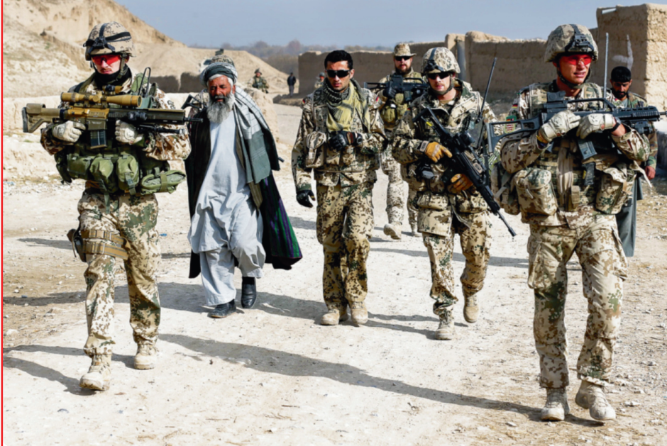
Soldats de la coalition internationale coopérant avec un chef de la police afghane.

QEYSAR KHEYL, NORD DE L'AFGHANISTAN, 2012