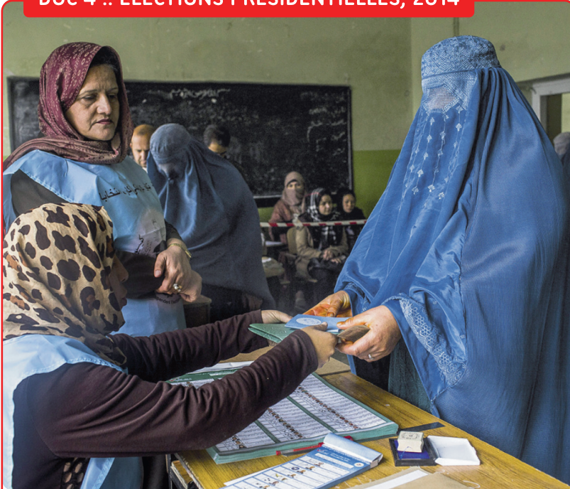
En 2014, les Afghan-e-s participent, pour la troisième fois depuis 2004, aux élections présidentielles.